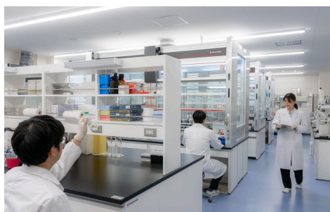
ラボで行う分析・検査事業