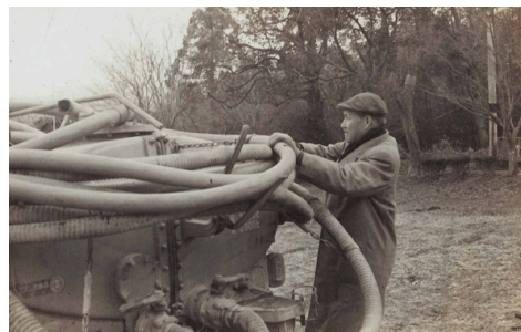
汲み取り業務に従事する初代代表取締役